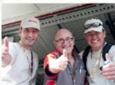
... kolme Loctite®-Charlieta, jotka ratkaisevat lähes minkä teknisen ongelman tahansa...