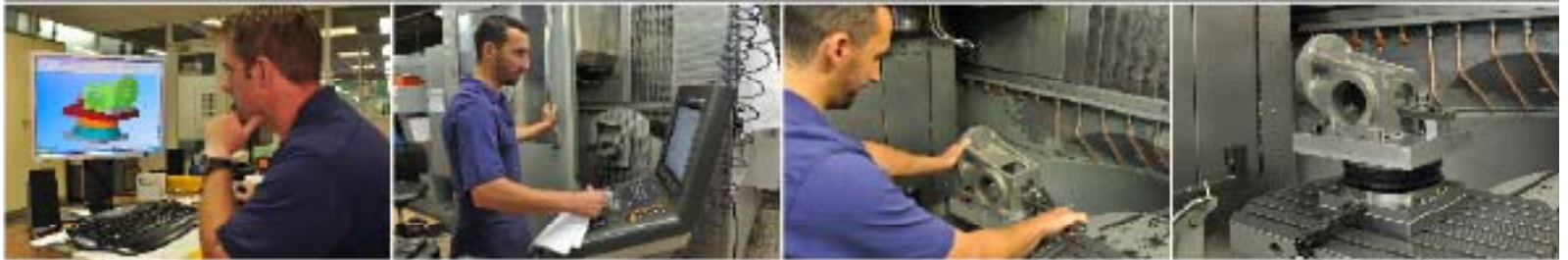
Huipputarkkojen osien valmistus alkaa täysin digitaaliselta pohjalta CNC-listojen avulla

Erikoiskoneiden valmistuksessa olemme käyttäneet Loctite®-liimoja ja kierrelukiteita jo pitkään. Siksi meille oli luonnollista kääntyä Henkelin puoleen, kun halusimme varmistaa, että tarrainlaitteemme koottaisiin luotettavasti. Nämä osat ovat puristuslinjojen keskiosassa, ja niihin kohdistuu toistuvia liikkeitä. Tuotannon nopeus johtaa yhä nopeutuviin kiihdytyksiin ja hidastuksiin, minkä vuoksi halusimme pystyä tehostamaan tuotantoprosessia. Näiden ajatusten perusteella kehitimme yhdessä rakenneliimaratkaisun, jossa käytetään hitsauksen sijaan Loctite® 9466-liimaa. Se tekee rakenteesta entistä joustavamman ja kestävämmän. Tämä innovatiivinen liimaratkaisu on jo voittanut puolelleen vakioasiakkaamme ja auttanut meitä pääsemään uusille markkina-alueille, etenkin Afrikkaan ja Etelä-Amerikkaan.”