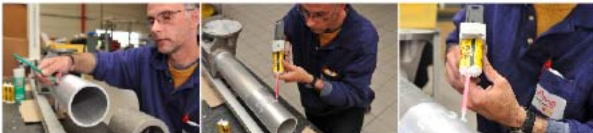
Loctite® 9466 2K Epoxy takaa alumiinin ja valetun alumiinin kestävät liitokset, jotka sietävät jopa kuuden g:n painovoimaa.