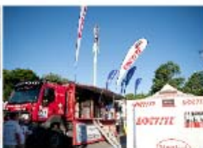
... Loctite®-huoltoautossaan. Se on vahingon sattuessa ensimmäinen rasti.