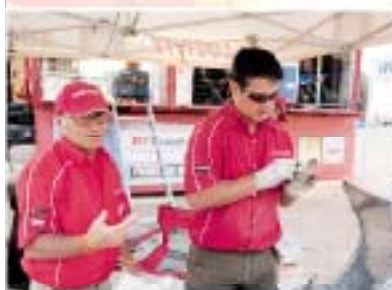
Aina kuljettajien tukena...