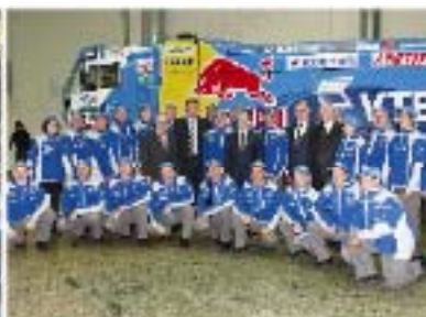
... historiallisesta menestyksestä ja onnistumisesta...