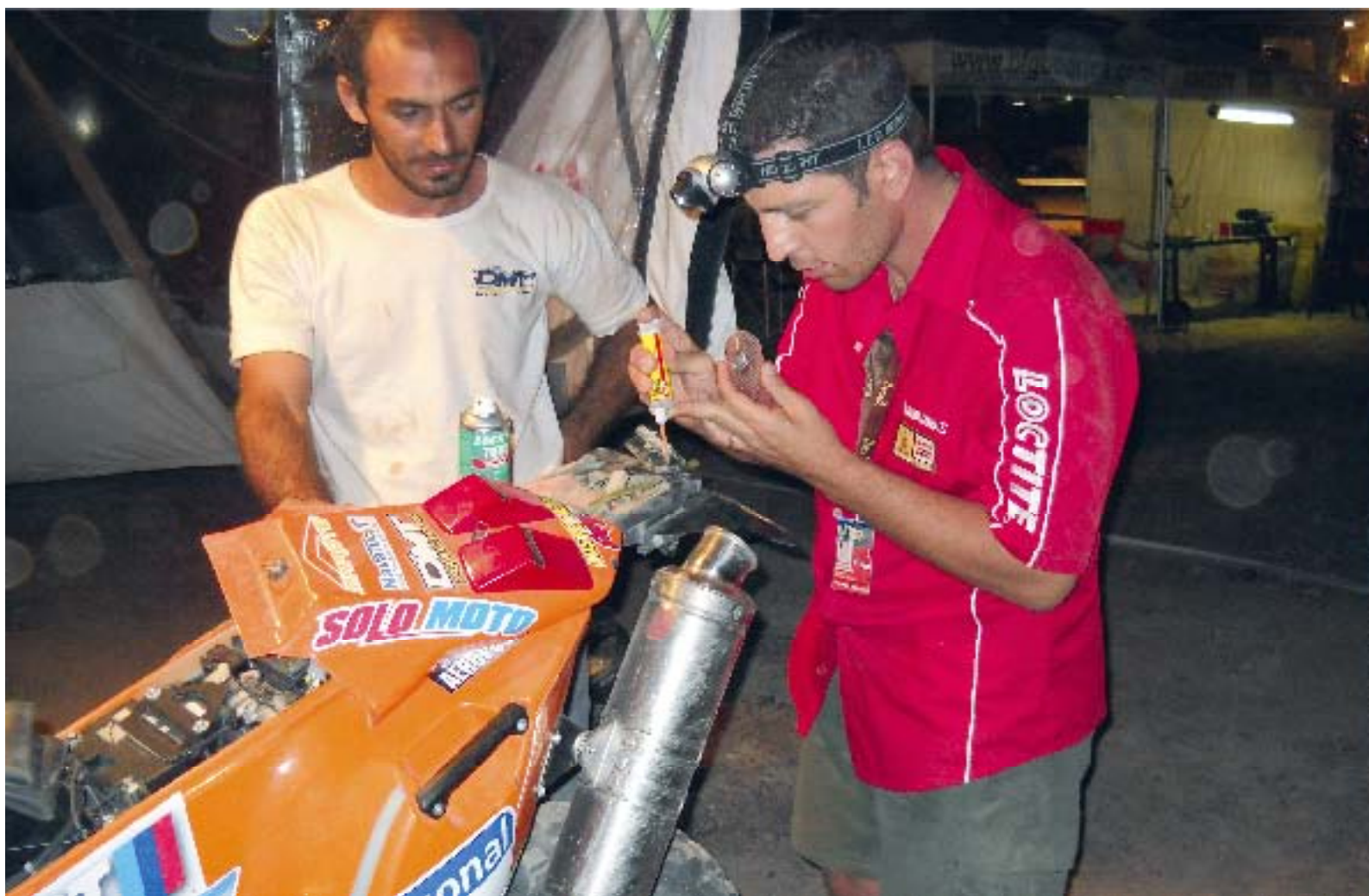
Uusi Loctite® 3090 on erittäin tehokas – myös äärimmäisissä olosuhteissa.