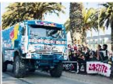
... KAMAZ-master-tiimiä ...