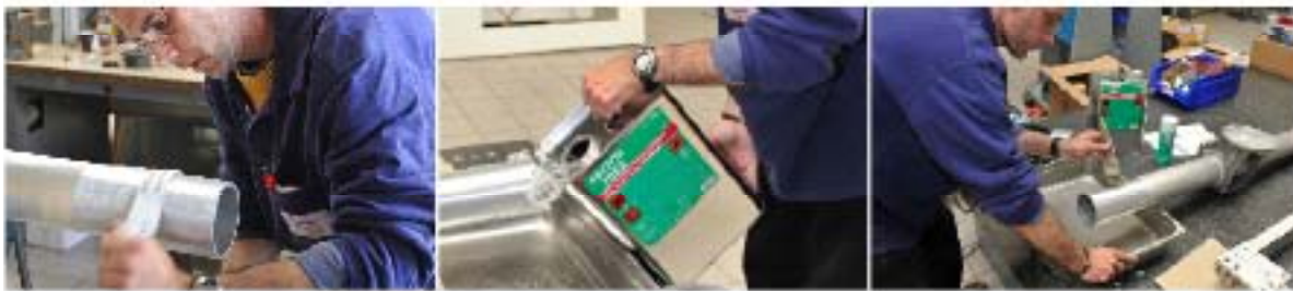
Osien huolellinen puhdistus ennen liimausta on ensiarvoisen tärkeää. Siksi Loctite® 7063 on ihanteellinen tarvike.