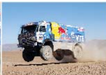
... vuoden 2010 Dakarissa, maailman vaikeimmassa rallissa.